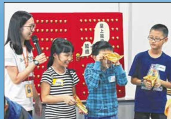
小朋友们在游戏中找到 锦囊 ③，看看里面到底藏着什么？

“明”、“慧”，还是“俊”、“杰”，都代表了父母对我们的期望，希望我们聪明又能干。紫禁城这个名字也有特别的含义：“紫”是指居于中天的紫微星，表示这里是世界的中心，而皇宫戒备森严，又是禁地，所以称为紫禁城。