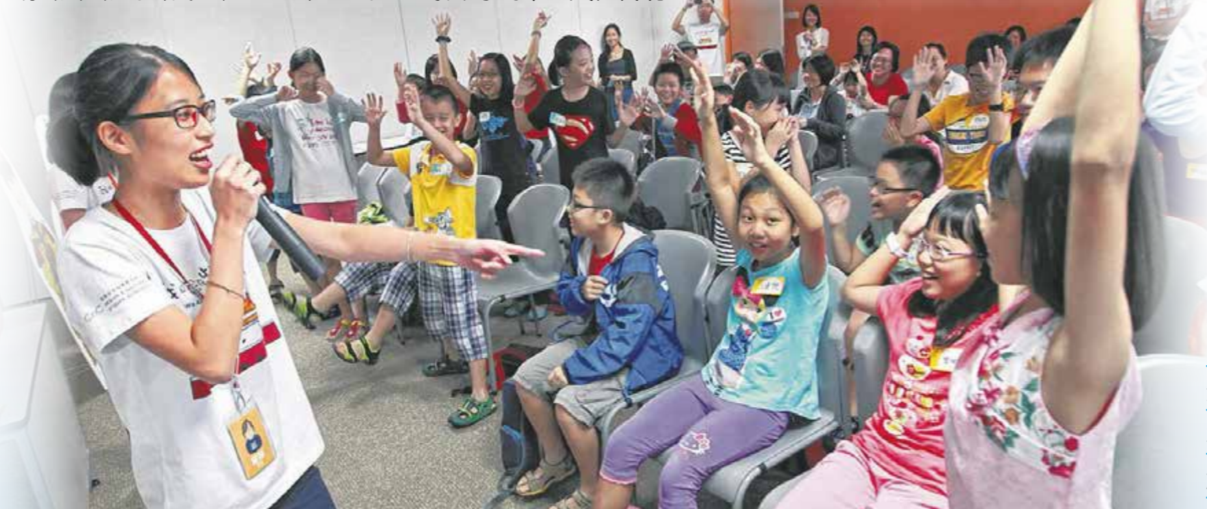
在工作坊导师的带领下，小朋友们一面学习中华文化，一面玩得好开心。

出去， 斩 ①了！”皇宫给人的印象就是这么 森严 ②可怕吗？你知不知道在这个帝王的家里，其实可以探索深厚的中国传统文化？